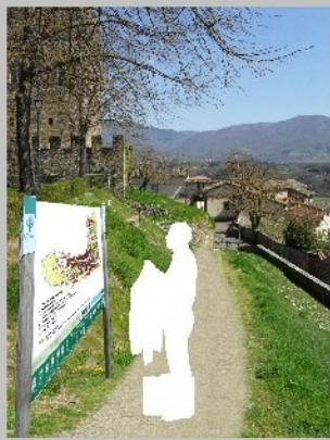
PROMOZIONE ED INFORMAZIONE NOLEGGIO BICI ED INFO POINT