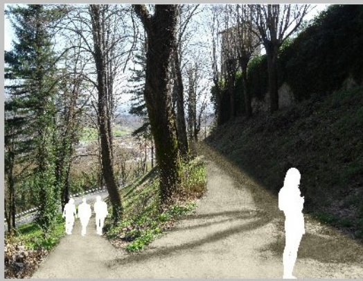
TREKKING URBANO INTORNO ALLE MURA